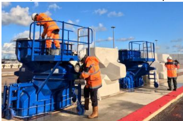
Travaux La fabrication des Accropodes™ de la digue de la chatière est lancée