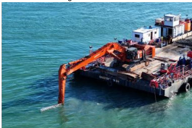
Travaux, Maritime Travaux de la chatière : la phase 1 progresse avec l'enlèvement des obstructions

Actualités - Affichage des résultats 1 à 8 sur 12 au total - 3 filtres | Accès Fluvial Port 2000