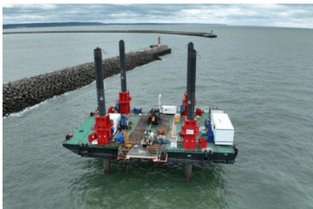
Travaux Digue de la chatière : lancement de la campagne géotechnique par HAROPA PORT