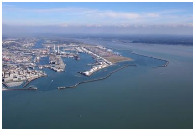
Travaux, Développement Accès fluvial à Port 2000 : le projet de la chatière passe à la vitesse supérieure