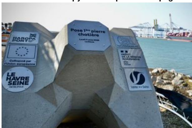
Développement, Travaux La chatière au Havre : une première pierre pour le développement de la multimodalité